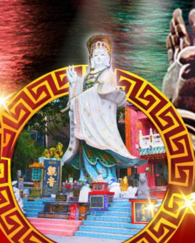
เจ้าแม่กวนอิม ทาคีพีส์เบย์

เมนูสุด พิเศษ!! ต้มช่าฮ่องกง บุฟเฟ่ต์ชาบูสโตร์ฮ่องกง, ห่านย่าง