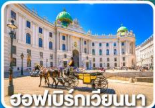
ฮอฟบิรกรเวียนนา