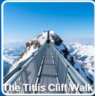
The Tittlis Cliff Walk