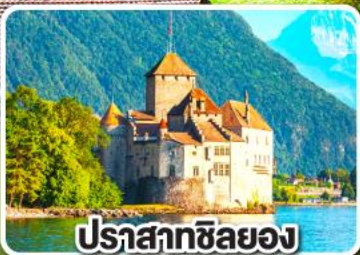
ปราสาทชิลยอง